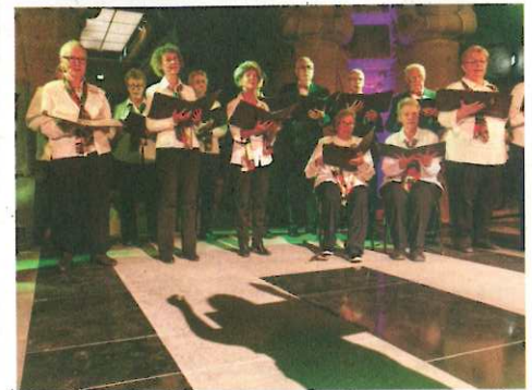
Der Grünauer Chor Leipzig.