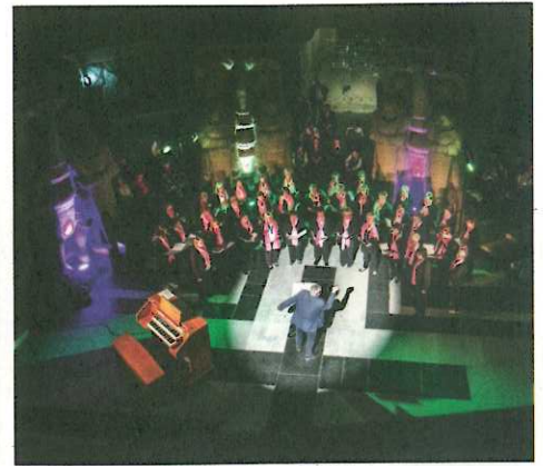
Der Salzland Frauenchor Staßfurt.