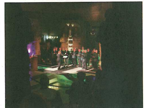
Männerchor Eula in der Krypta.