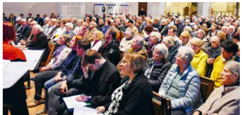
Die bis zum letzten Platz besetzte Stadtkirche. Mehrere Interessenten mussten draußen bleiben.

in Frage käme. Bei der Stadt Borna hingegen war man skeptisch und dachte an etwas anderes, konkret an das Bornaer Zwiebellied mit dem schönen Text „Noch immer heißt es Zwiebelborne, das Zwiebelborne gilt noch heut“. Hier hat man stets die Nase vorne, doch Zwiebelborne, das bleibt.“ Doch damit stieß man auf wenig Gegenliebe, und wer am Ende des Konzerts in der Stadtkirche erlebte, wie das Publikum sich wie ein Mann erhob und textsicher alle Strophen des Steigerlieds inbrünstig sang, wusste, dass damit die richtige Wahl getroffen worden war. Ein schöner Abschluss für eine besondere Veranstaltung, der die Stadt Borna, so wurde im Nachgang mitgeteilt, bei Gelegenheit gerne eine ähnliche folgen lassen möchte. Bis dahin treffen sich die Chöre wieder beim »Singenden Südraum«.