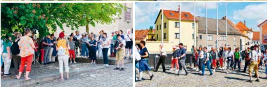
Die Liebe zu ihrer Stadt war bei den wandernden Sängerinnen und Sängern zu spüren.

Stunden hinweg wurde an verschiedenen Orten im Park und vor dem Palais gesungen. Immer wieder blieben Besucher stehen, hörten zu oder begleiteten den Chor ein Stück seines Weges. Die musikalischen Beiträge wurden von den Gästen des Parks sehr positiv aufgenommen. Viele freuten sich über die unerwarteten musikalischen Begegnungen. „So schön hat der Zabeltitzer Park noch nie geklungen“, war dabei mehrfach zu hören.