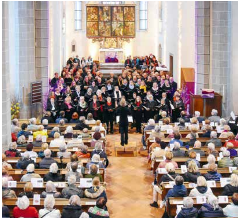
Gelungener Auftakt mit der gastgebenden Kantorei St. Marien gemeinsam mit dem Chor der Neuapostolischen Kirche.

Lange Diskussionen – so viel darf aus den Interna verraten werden – gab es im Vorfeld um den gemeinsamen Abschlusstitel mit dem Publikum. Als das Thema beim Treffen der Gruppe Süd des Leipziger Chorverbands im November angesprochen wurde, war für alle Anwesenden klar, dass dafür nur das Steigerlied