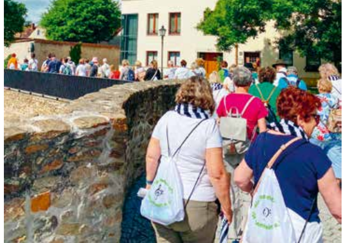
Singen gehört zum Wandern – das zeigte sich auch beim 15. Sächsischen Wandertag in Großenhain.

Die musikalische Wanderung der Singgemeinschaft Großenhain war eine der besonderen Touren beim 15. Sächsischen Wandertag in Großenhain Anfang Juni. Als einzige musikalische Wanderung im gesamten Programm verband die Tour 16 gemeinsames Wandern mit gemeinsamem Singen. Das Angebot stieß auf großes Interesse und war bereits im Vorfeld ausgebucht. Insgesamt 63 Teilnehmerinnen und Teilnehmer gingen mit der Singgemeinschaft Großenhain auf den Weg. An vier Stationen wurde gemeinsam gesungen: am Kulturschloss, in der Marienkirche, vor einem Seniorenheim und zum Abschluss auf dem Kupferberg. Begleitet wurden die Lieder von einem Sänger des Chores am Akkordeon. Dank der vorbereiteten Liederhefte konnten alle Teilnehmenden unkompliziert mitsingen – unabhängig davon, ob sie Chorererfahrung hatten oder nicht.