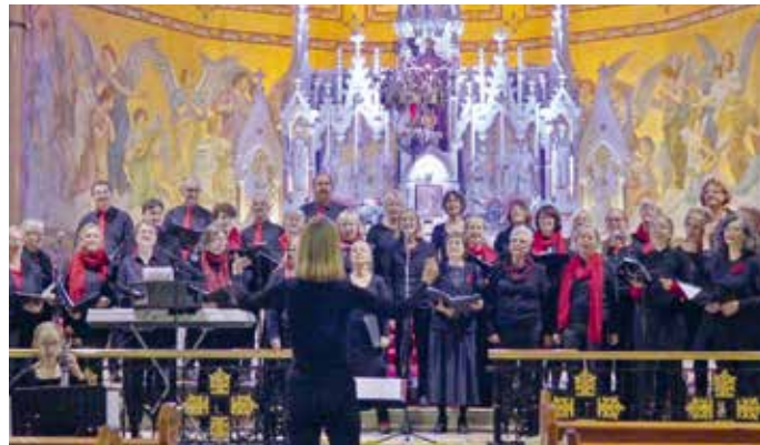
Choraustausch zwischen Irland und Dresden.

Das Ensemble sucht in jährlich acht bis zehn Konzerten immer wieder nach neuen Impulsen, um unsere musikalische Arbeit weiterzuentwickeln und Menschen für das gemeinsame Singen zu begeistern. 2025 trug es Chormusik aus Sachsen nach Irland und brachte neue musikalische und kulturelle Impulse zurück in die eigene Chorarbeit. Erste Kontakte nach Irland entstanden 2024, als man mit dem irischen Frauenchor Cór Comáin aus Roscommon in Kontakt kam. Dies sollte im Oktober 2025 vertieft werden. Dazu reisten 25 Chormitglieder im Oktober nach Irland. Dort probten sie mit dem Cór Comáin und gestalteten ein gemeinsames Konzert. Dabei präsentierte der Freie Chor Dresden ein Repertoire, das bewusst dessen musikalische Vielfalt widerspiegelt und Chor-