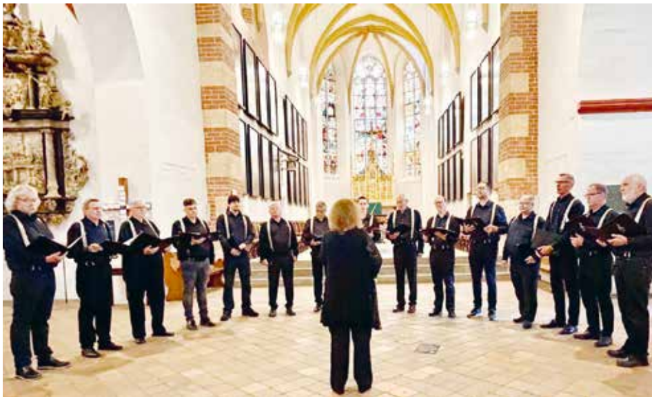
Ein besonderer Auftritt: Der Männerchor Borna gestaltete den ökumenischen Dankesgottesdienst zum Tag der Organspende in der Thomaskirche mit.