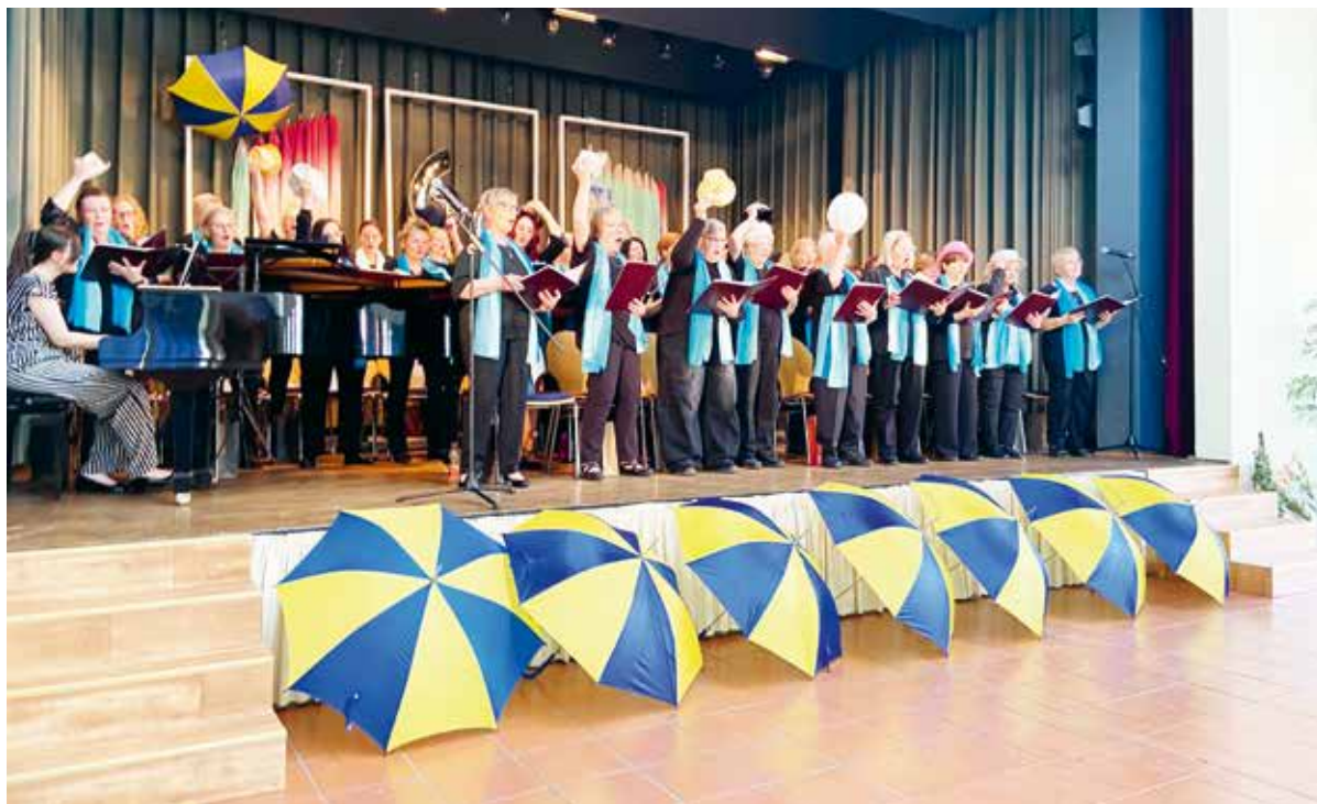
Schlagler auf den Lippen, Hüte in der Luft – so feierte der Schulze-Delitzsch-Frauenchor seinen 60. Geburtstag.