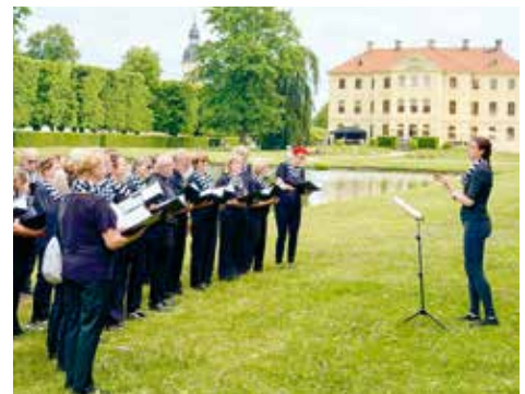
Auch zum »Tag des Parks« war die Singgemeinschaft Großenhain unterwegs.

Einen Tag nach der Wanderung war die Singgemeinschaft Großenhain erneut unterwegs. Beim »Tag der Parks und Gärten« in Zabeltitz gestaltete der Chor einen Walking Act. Über zwei