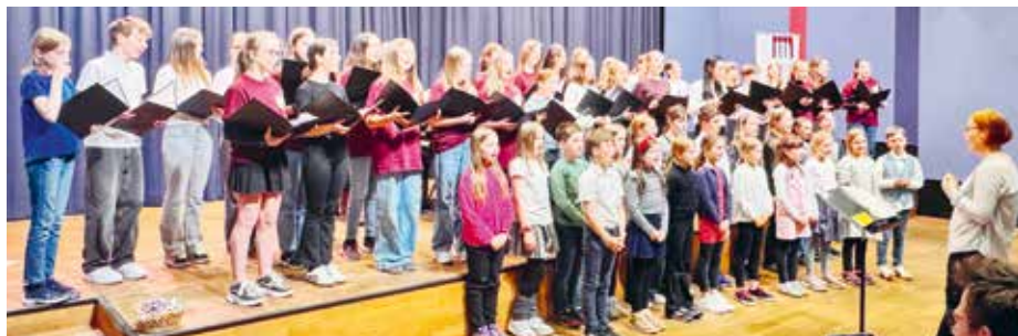
Gemeinsam singen und sich kennenlernen ist eines der Ziele des Kinderchorfestes des Musikbundes Chemnitz.

Leider gestaltete es sich auch in diesem Jahr schwierig, Schulchöre in Chemnitz und aus der Region zur Teilnahme am Kinderchortag des Musik-