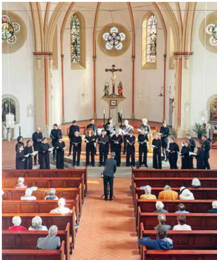
Die Herz-Jesu-Kirche in Thale ließ den Chorgesang sich besonders eindrucksvoll entfalten.

Im Zentrum der 45-minütigen Aufführungen standen Werke aus dem 17. bis ins 21. Jahrhundert, die ganz unterschiedliche Perspektiven auf Stillstand, Aufbruch und Neuanfang bündelten. Franz Schuberts »Der Leiermann«, in der Fassung von Lukas Zschorlich, zeichnete ein Bild von Resignation und innerer Erstarrung. Einen Spannungsbogen hin zu Zuversicht und Bewegung schlugen darauffolgend die Stücke »Hope is a thing with feathers« von Ivo Antognini und »Earth Song« von Frank Ticheli. Den Abschluss setzte Zoltán Orbáns »Mundi Renovatio«. Insbesondere im Sakralbau der Herz-Jesu-Kirche in Thale konnte sich das Ensemble klanglich eindrucksvoll entfalten und auf die bevorstehende Sommerreise nach Trier einstimmen.