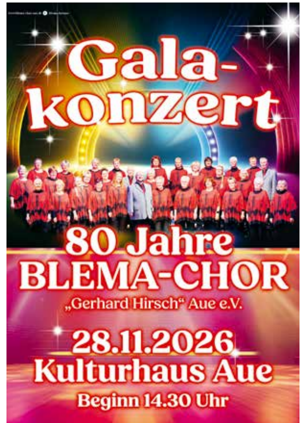
Große Gala im November in Aue – die Vorbereitungen auf das Jubiläum laufen auf Hochtouren.

Am Vorabend des Ersten Advents werden sie alle gemeinsam auf der Bühne stehen und acht Jahrzehnte Chorgesang in Aue Revue passieren lassen. Und wenn es danach etwas geselliger wird, der Puls sich beruhigt, wird sich so manche