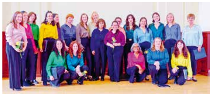
Der Internationale Frauenchor Leipzig.

rinnen Programme, die musikalische Traditionen aus unterschiedlichen Teilen der Welt zusammenführen. Erst Ende Juni trat der Internationale Frauenchor Leipzig in der Stadtbibliothek auf und wird am 26. September im GRASSI Museum für Völkerkunde zu