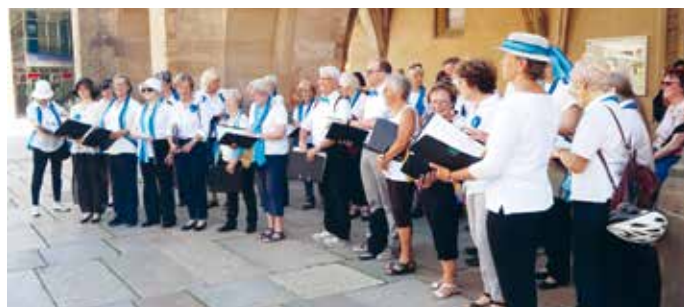
Eine Stadtführung mit Pfiff und Gesang.

Mit dem Projekt »StadtKlangErlebnis – Eine Stadtführung mit Pfiff« (»unisono« berichtete in Ausgabe 2/2025) punktete Ensemble Musica Chemnitz. Die musikalische Stadtführung führte zu historischen, kulturellen und musikalischen Stationen durch Chemnitz und sollte im Europäischen Kulturhauptstadtjahr das Erbe und die Vielfalt von Chemnitz für Einwohner, Touristen und Kulturinteressierte erlebbar machen.