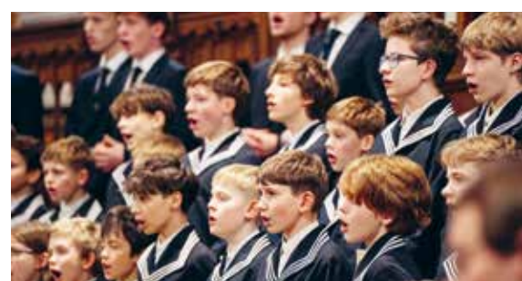
Calmus, Schola Cantorum, Lypo, Sjaela, Ensemble Nobiles und der Thomaner Leipzig werden unter anderem in Konzerten zu hören sein.